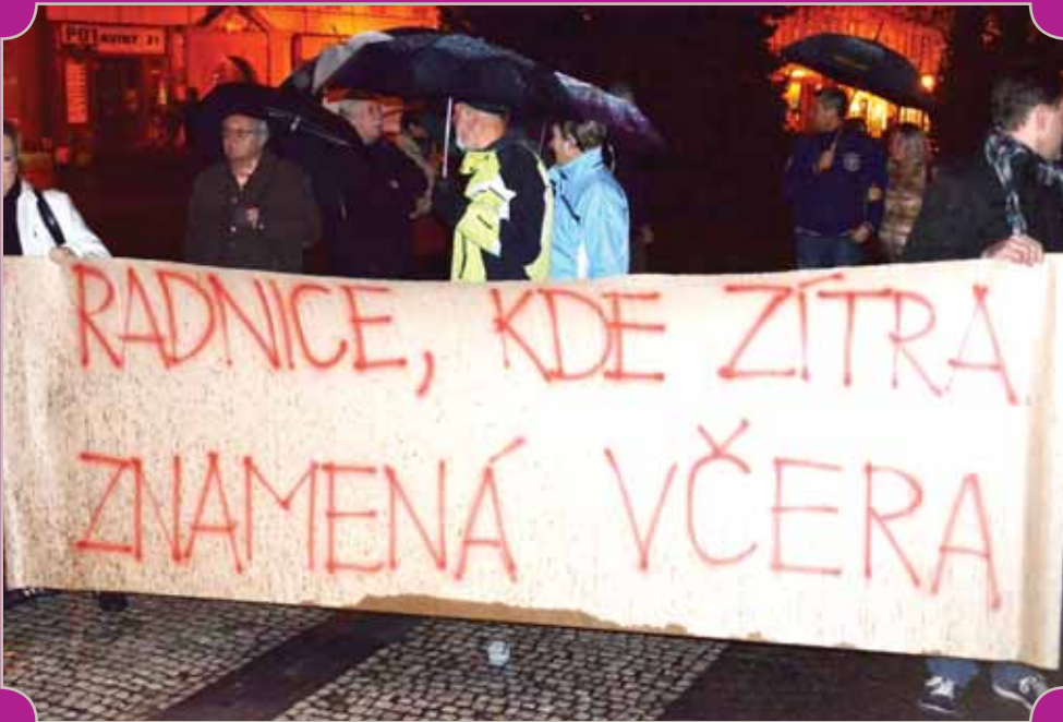
Vystihuje všechno. Po říjnových komunálních volbách se v Prostějově po pětadvaceti letech od „sametové revoluce“ dostali do vedení města komunisté. Naštvaní Prostějované dokázali nastávající politickou situaci na radnici vystihnout i vtipným způsobem.