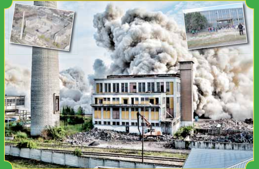
Historie zmizela. V sobotu 28. června se tuny dynamitu postaraly o definitivní konec Oděvního podniku. Po největším oděvnickém kolosu na světě zbyl jen hustý bílý dým. Kus slavné historie Prostějova byl srovnán se zemí.