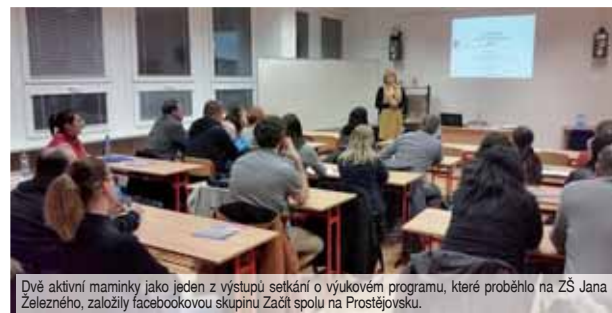
Dvě aktivní maminky jako jeden z výstupů setkání o výukovém programu, které proběhlo na ZŠ Jana Zelezného, založily facebookovou skupinu Začít spolu na Prostějovsku.