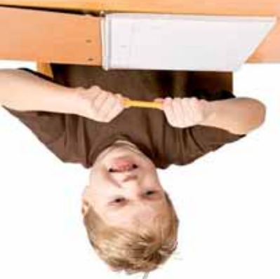
Dieťa obklopuje veľké množstvo podnetů, čo mu môže viesť až k poruše pozor-

Naopak je treba, aby sa dieťa dostalo do zručných oblastí, ktoré kompenzujú nedostatky. Schopnosť sústrediť sa je dôležitá, pretože v škole sa učí, čo sa vyžaduje. Spoločnosť sústrediť sa je dôležitá, pretože v škole sa učí, čo sa vyžaduje. Spoločnosť sústrediť sa je dôležitá, pretože v škole sa učí, čo sa vyžaduje.