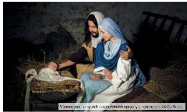
Vánoce jsou v myslech nejen věřících spojeny s narozením Ježíše Krista.

Historicky je za vznik Vánoc možné považovat období na přelomu třetího a čtvrtého století, protože první zmínky jsou v řeckém kalendáři Furia