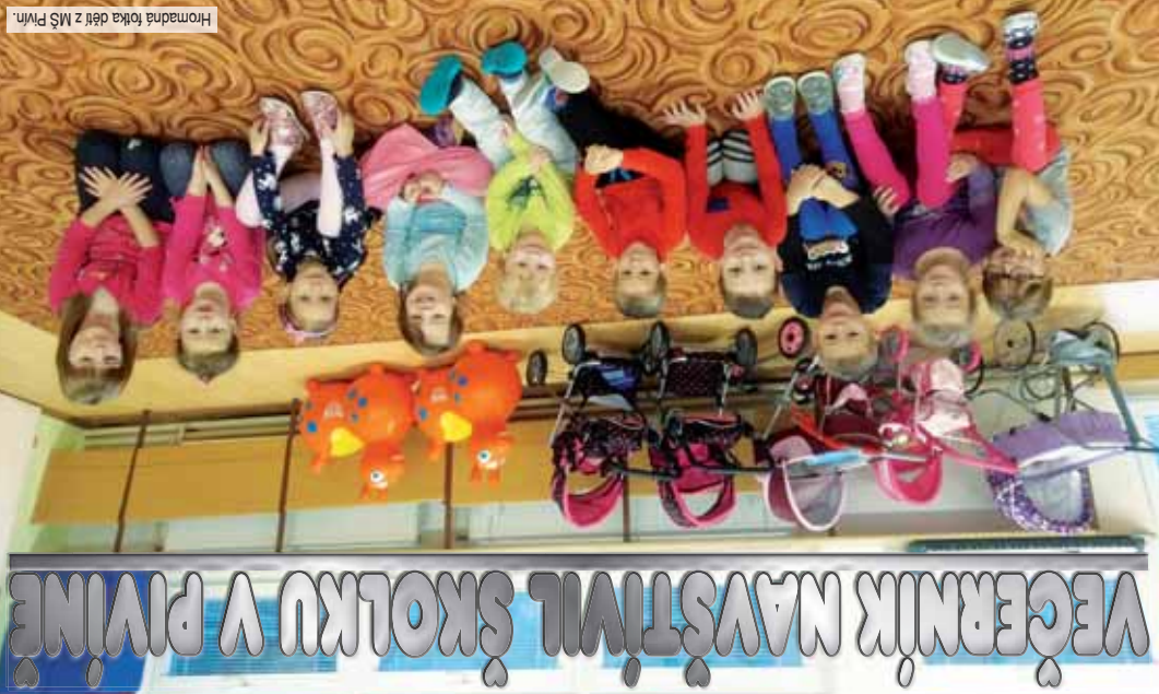
Hromadná fotka dětí z MŠ Pivín.