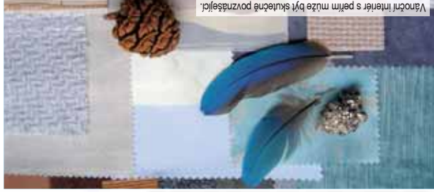
Vánoční interiér s perlm může být skutečně povznesajícím.

Udělejte si Vánoce LEHKĚ JAKO PÍRKO Pokud droze o letostřech Vánocích pít s ním nolympijským. Inspire se atmosférou dálkové severu, tajuplné horské chry a daných tradic. Prání by vám napout, jak si paprkat okouzluje sady přímo v teple vašeho domova. Učte experimentovat, ote sítě mějte na paměti, že klasika se na Vánoce hodí každý hotel.