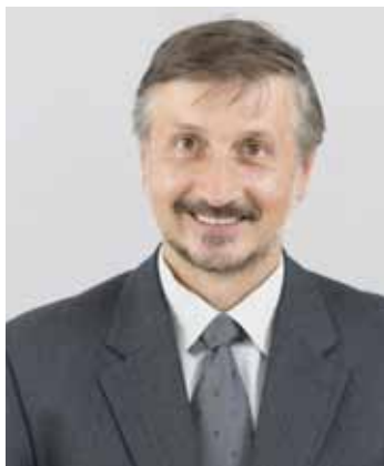
Často mění politické kabáty. V těchto volbách schoval TOP 09, když tužil propadák, pod spojení s Piráty. Při diskusích se ohání demagogií, často přistižen při lži.