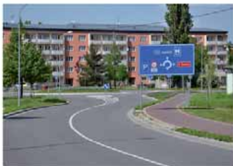
Cyklostezky, křižovatky - nová dopravní infrastruktura