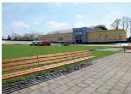
Velodrom má novou, svěží tvář