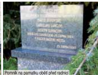
Pomník na památku obětí před radnicí