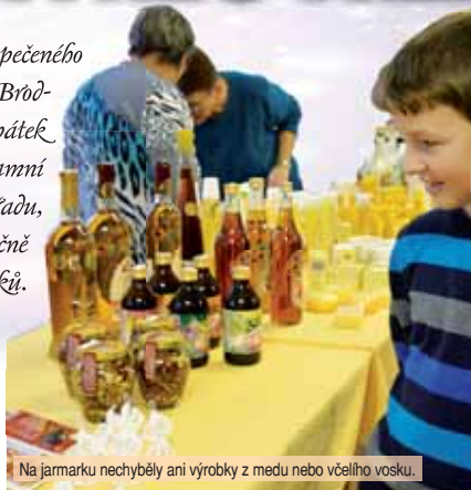
Na jarmarku nechyběly ani výrobky z medu nebo včelího vosku.

Vůně borkeého pomerančového punče, čerstvě napečeného cukroví a perníčků se linuly celým kulturním domem v Brodce u Konice. V takové atmosféře zde druhý prosincový pátek premiérově proběhl vánoční jarmark. Pořádaly jej tamní základní a mateřská škola a kulturní komise obecního úřadu, které do programu zahrnuly jednak prodejní výstavu ručně dělaných výrobků, ale i pestrá hudební vystoupení žáků. A Večerník byl u toho!