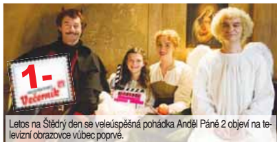
Letos na Štědrý den se veletépná pohádka Anděl Páně 2 objeví na televizní obrazovce vůbec poprvé.