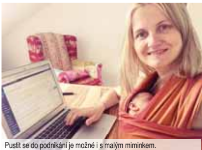
Posít se do podnikání je možné i s malým miminkem.

Postupujte raději pomalu krok za krokem, plňte naplánované činnosti jednu po druhé. Je jedno, jestli se vám to povede za rok, dva, tři nebo pět let. Dálek důležitéjší je, aby to tempo rezonovalo s vámi. S vašimi potřebami a potřebami dětí a rodiny. Každá aktivita, čin, které pro své podnikání uděláte, vás posunou vpřed, pokud