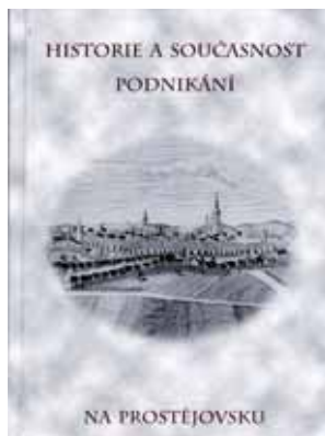
Tato publikace by se mohla stát součástí knihovničky každého prostějovského patriota.

Autory historické části jsou pracovníci Státního okresního archivu v Prostějově Tomáš Cydlík a kolektiv autorů. Text je doplněn o řadu dobových fotografií, portrétů i ilustrací. Kniha je rozdělena na dvě základní části, a to historii podnikání a podnikatelskou současnost. V první části kniha pojednává o přechodu od cechů k živnostenským společenstvům, dále pak o řemeslech židovského obyvatelstva či počátcích průmyslu a rozvoji podnikání v městě Prostějově do roku 1948. V samostatných kapitolách se ohlíží podrobněji i za podnikáním na Plumlovsku, Konicku a Němčicku. Kniha je zaměřena zejména na textilní, kožedělný, kovodělný, dřevozpracující a potravinářský průmysl, stavitelství a rozvojem města. U řemeslníků se autory mimo mnoha dalších zabývají například známými fotoateliéry, holiči, lázněmi a řadou dalších tradičních oborů, které u nás fungují dodnes.