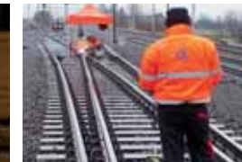
SERVIS A REGENERACE