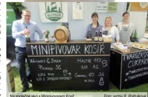
Na společné akci s Minipivovarem Kosíř.