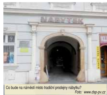
Co bude na náměstí místo tradiční prodejny nábytku? Foto: www.dsp-pv.cz

na Žižkově nám. 19. Další dvě najdete na adrese nám. T. G. Masaryka 11. První z nich má rozlohu 102,94 m 2 , druhá 54,03 m 2 . Více informací stejně jako pravidelně aktualizovanou nabídku najdete na stránkách Domovní správy Prostějova. Volné místo je i v Domě služeb na Sídlišti E. Beneše. Foto: www.dsp-pv.cz.