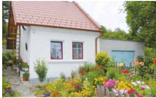
Těšíte se už na chalupu? Záleží jen na vaší fantazii, jak si ji zařídíte.

Naopak staré a funkční věci jsou žádané. Dejte přednost věcem, které už něco zažily a mají „duši“. Krásné se zde budou vyjímat třeba staré dřevěné židle z bazaru nebo hrnky, talíře či sklenky, když už doma nemáte celou sadu. Je však třeba dodržovat pravidlo, že byste měli mít ze série vždy aspoň dva až tři kusy, nikoli jen jeden, aby vám nevznikl interiér ve stylu každý pes jiná ves.