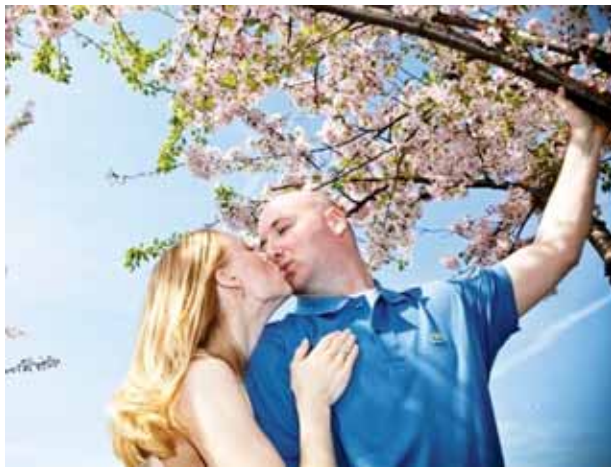
K pravému jaru ve dvou neodmyslitelně patří polibek pod rozkvetlou třešní.

Jakmile na jaře vysvitnou sluneční paprsky, začínou svou roli hrát endorfiny a serotonin, jejichž hladina v krvi také stoupá. Díky tomu máme lepší náladu a více energie. S tím je samozřejmě spojena i chuť na sex a touha po intimním sblížení. Teplé počasí navíc přímo vybízí k milostným hříčkám v přírodě. To může řadu lidí povzbudit, protože se konečně vymani ze zimního ložnicového stereotypu. Jaro zkrátka sexu přaje.