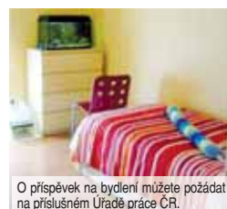
O příspěvek na bydlení můžete požádat na příslušném Úřadě práce ČR.

O příspěvek na bydlení může žádat kdokoli, kdo má vysoké náklady a zároveň nízké příjmy. Žádat může jak jednotlivec, tak i rodina nebo víceletná domácnost. O dávky by měl podávat žádost ten, kdo má v daném bytě nebo domě vedené trvalé bydliště. Může se jednat o dům nebo byt v osobním vlastnictví. Nebo to může být družstevní byt či byt v pronájmu. Jako „byt“ se v tomto případě považuje i samostatná místnost určená k trvalému bydlení. To znamená, že klasická ubytovna nebo dokonce hotel se nedá považovat z tohoto pohledu za byt. Navíc by zde ani nebyla splněna podmínka trvalého bydliště. U jednoho bytu je možné o příspěvek žádat pouze jednou. Není tedy možné, aby u jednoho bytu žádaly o dávku dvě různé osoby.