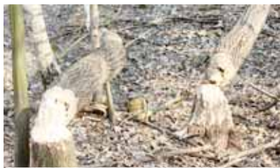
V Litovelském Pomoraví se pevně zabydleli i bobři.

Náš doporučení však radí vydat se po červené. Tato turistická značka vás zavede do přírodní rezervace Vřepáč. Krásy lužního lesa vyniknou nejlépe