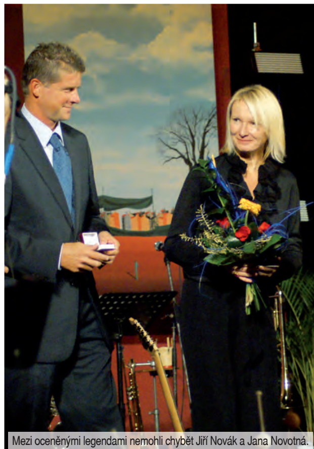
Mezi oceněnými legendami nemohli chybět Jiří Novák a Jana Novotná.