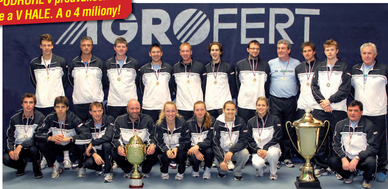
Tento prostějovský tým vyhrál extraligu loni. Jen mírně obměněný výběr se pak vydal za obhajobou, která by navíc dovršila výjimečnou sezónu TK Agrofert.

SENIORSKÁ EXTRALIGA smíšených družstev se odehraje UŽ PODRUHÉ v předvánočním čase a V HALE. A o 4 miliony!