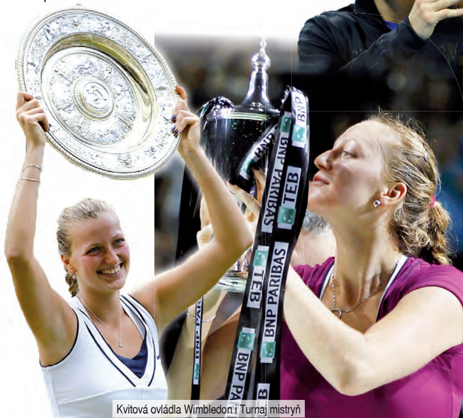
Kvitová ovládla Wimbledon i Turnaj mistryň