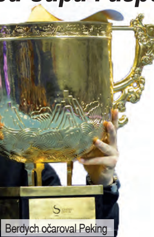
Berdych očaroval Peking

Historie se v tomto bodě potkala s přítomností, aby společně vyzrazily vstřícnou budoucnost. Snad v ní prostějovský tenis čekají další nádherné i hluboké zářezy do výsledkového rámu památných triumfů.