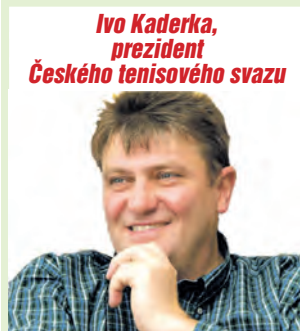
Ivo Kaderka, prezident Českého tenisového svazu

Pro znalce bílého sportu a tenisové fajnšmekry jsou probíhající dny opravdovým zážitkem. V plném proudu totiž je Česká spořitelna tenisová extraliga smíšených družstev 2011, v rámci níž na čtyřech místech České republiky měří síly řada špičkových hráčů i hráček z popředí světových žebříčků. Trojice kompetentních osobností tak na celou soutěž ještě před jejím startem oprávněně pěla ódy.