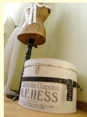
Nostalgická klobouková krabice je jedním z mnoha dalších krásných výrobků pro útulný domov.